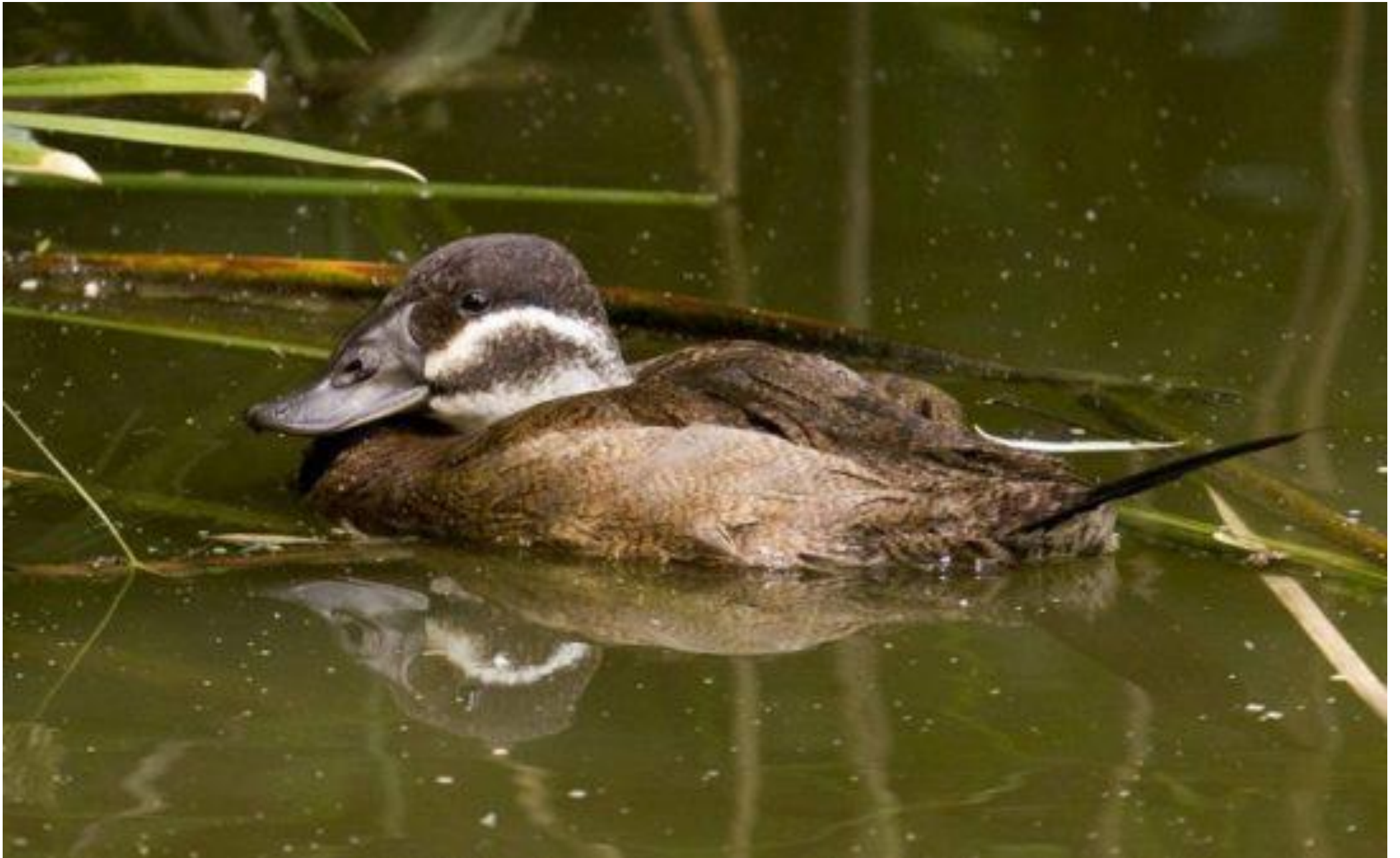
Приложение №4 Утка савка (самочка)