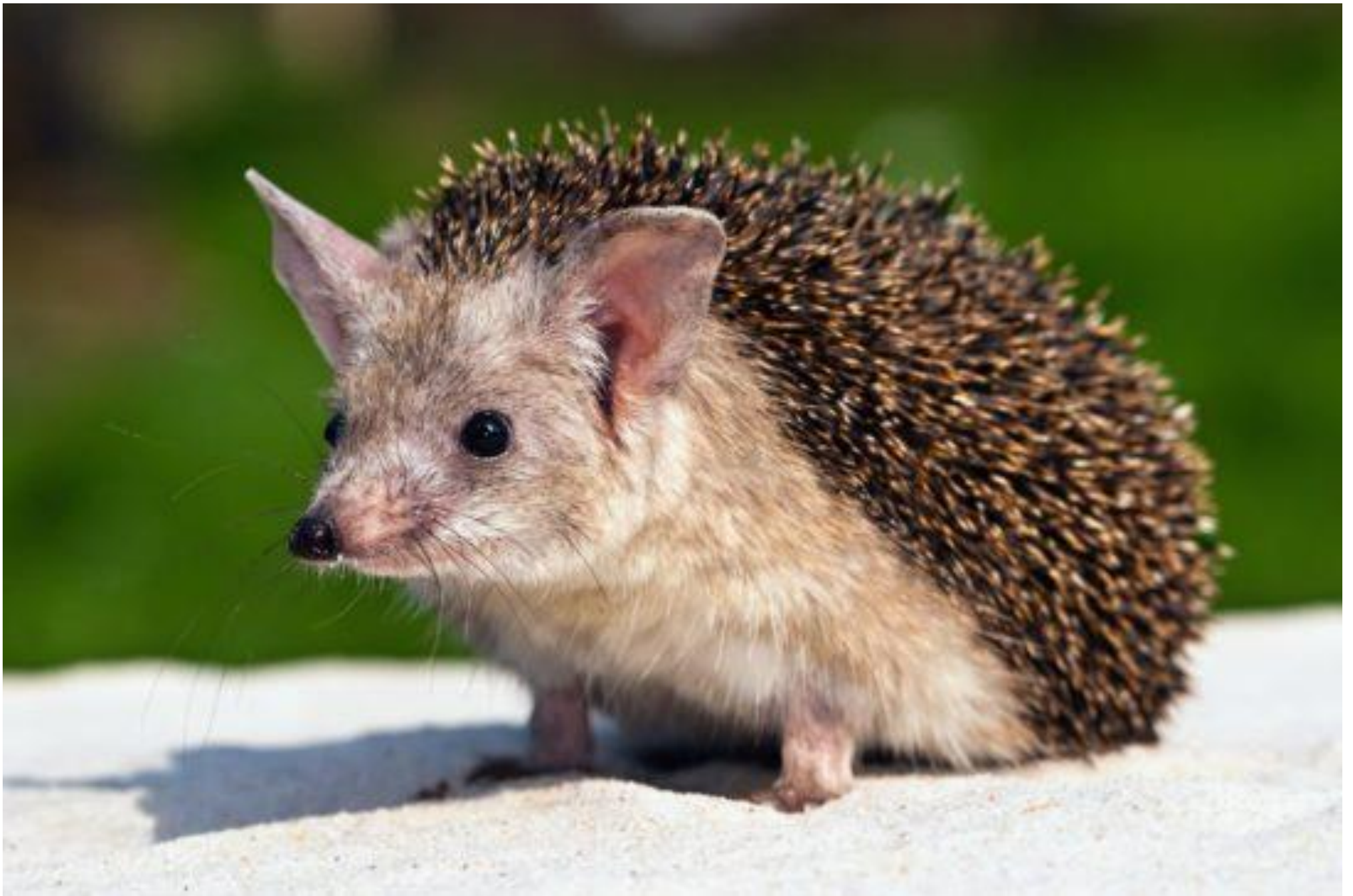
Приложение № 3 Ушастый еж