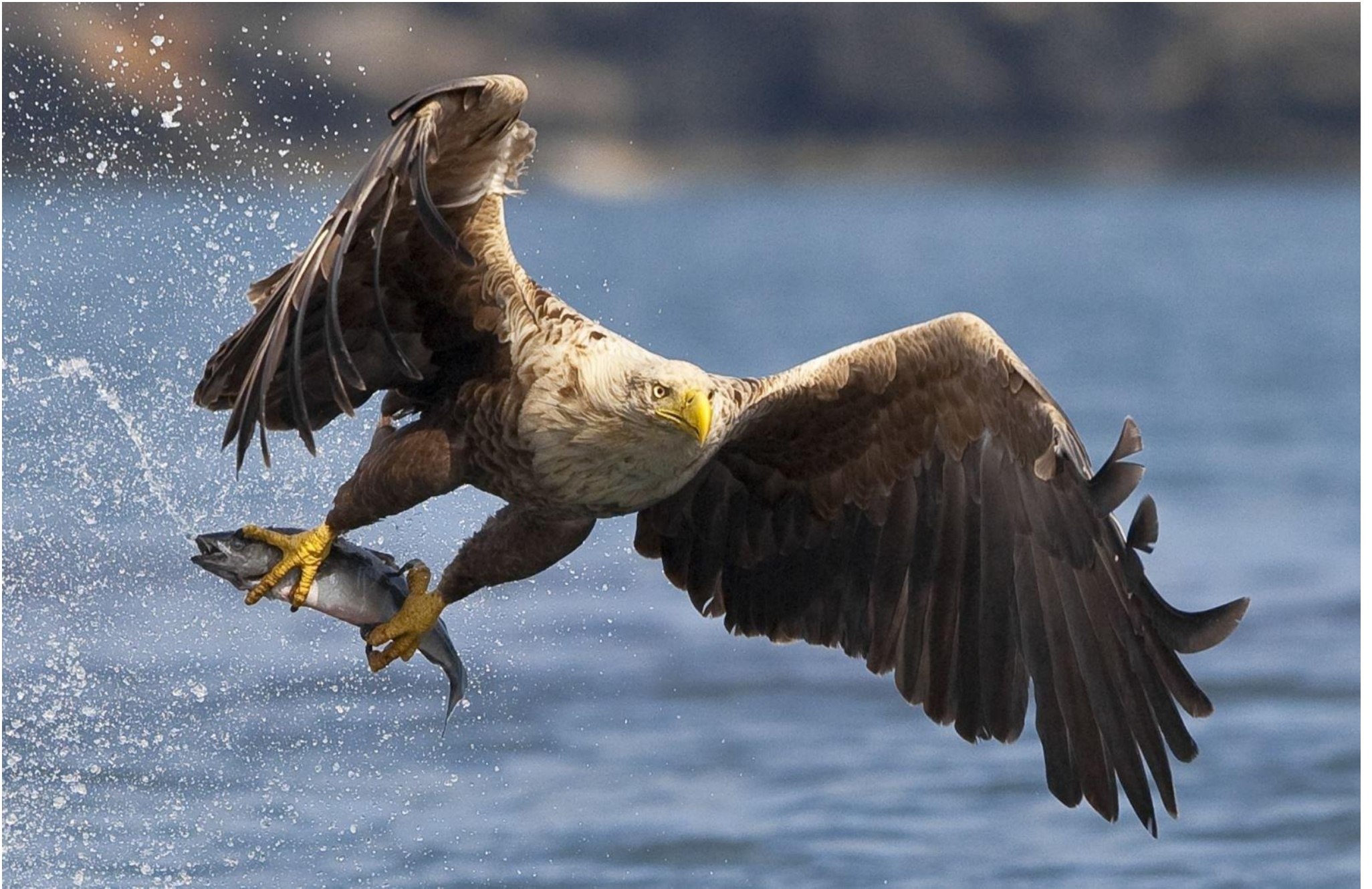
Приложение № 8