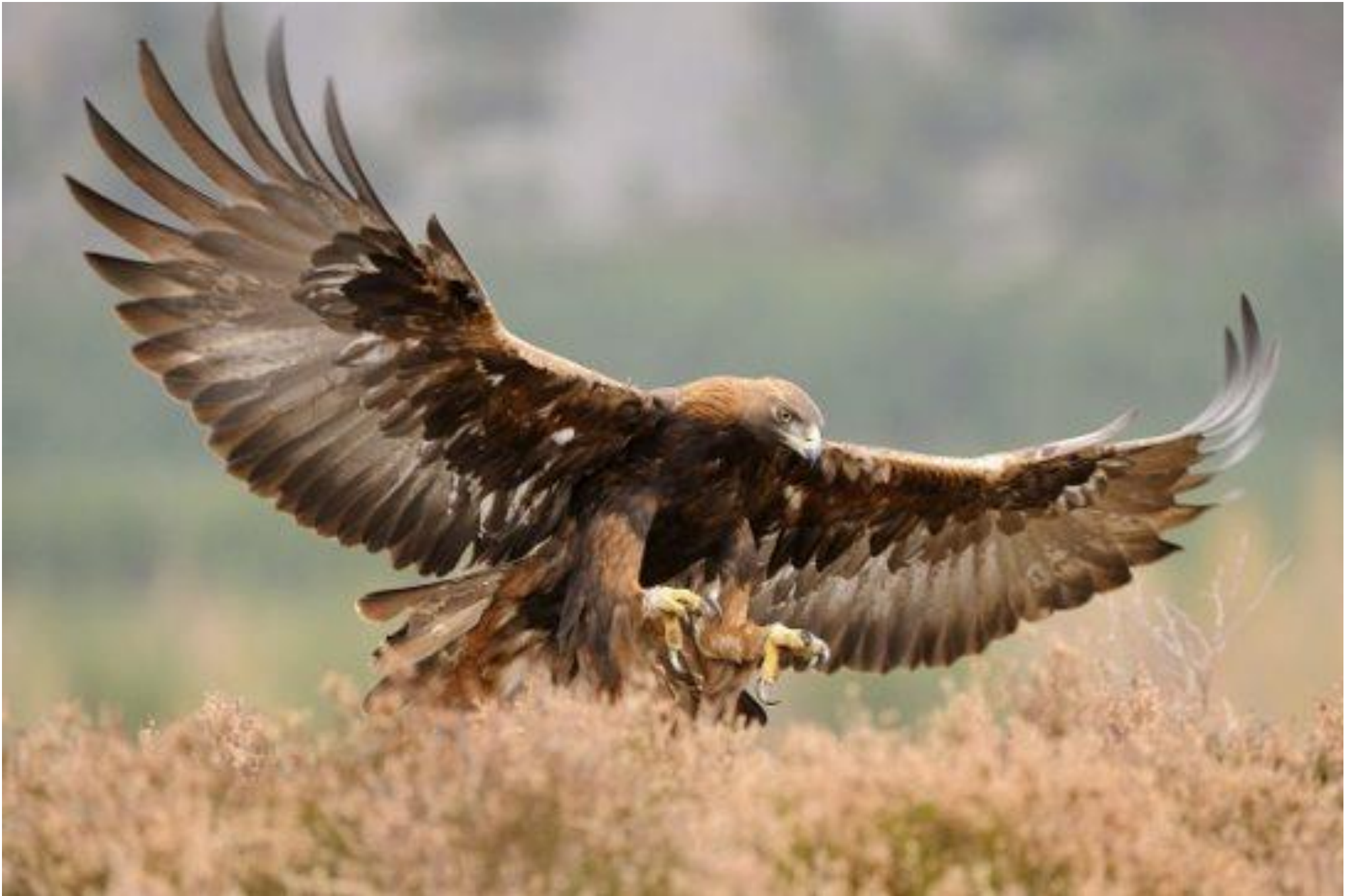
Приложение № 6 Беркут