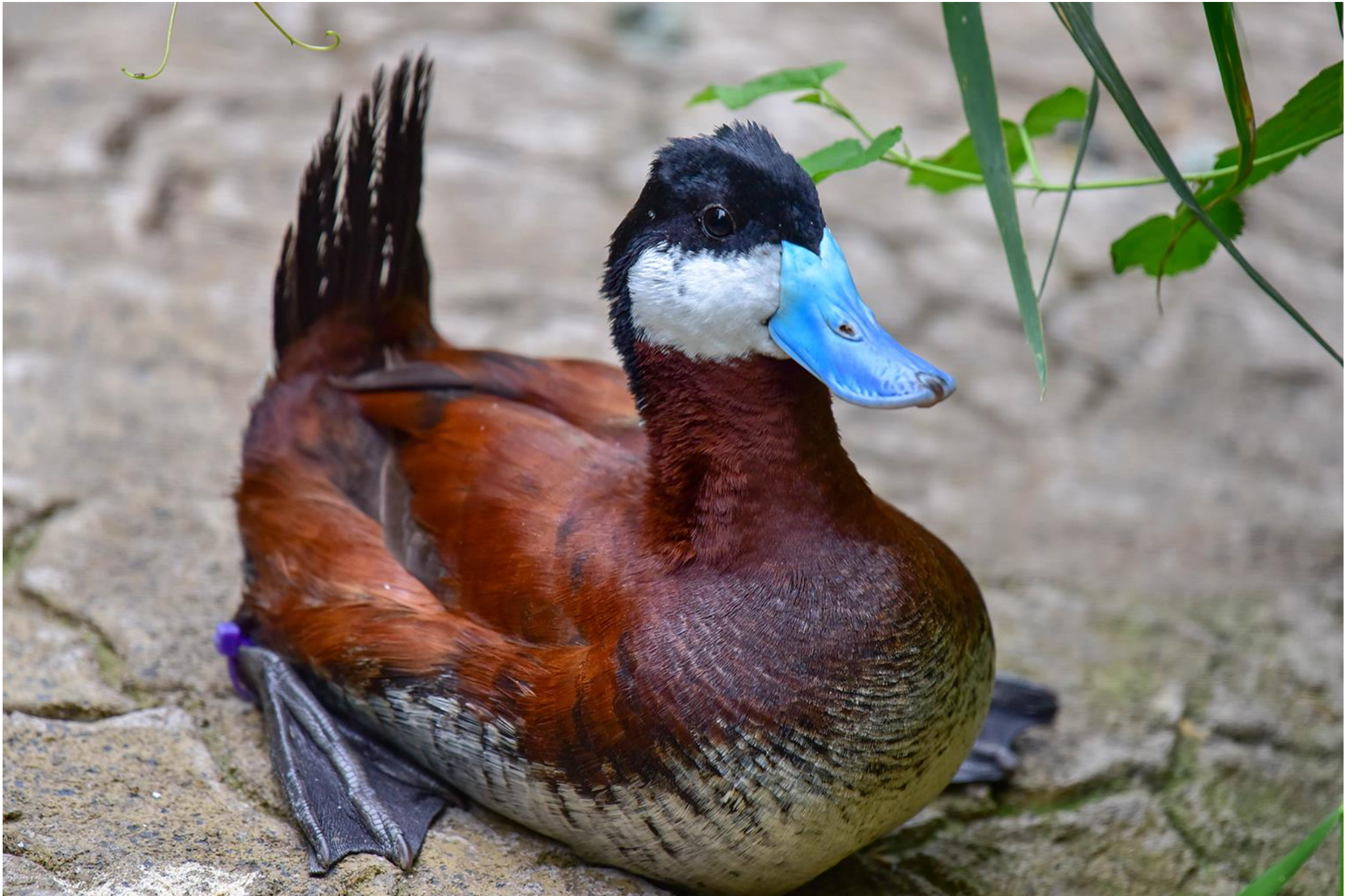
Приложение № 5 Утка савка (самец)