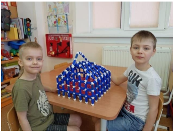
Совместная деятельность «Построй дом»